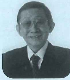
すぎやま こういち氏

1946年9月京生まれ。1967年～1971年、「ザ・タイガース」のドラマーとして一世を風靡する。グループ解散後に慶應義塾大学文学部に進学、同大学院修士課程修了。卒業後は慶應義塾講師となる。北京大学に2年間留学し、現在も頻りに北京を訪ね中国語も堪能。2011年、沢田研二ら元メンバーからの熱心な呼びかけに応じ、再びミュージシャンとして活動を再開する。著書に、その復帰までを綴った「ロンググッバイのあとで」(集英社)、2011年～2012年のソロツアーなどをまとめた「老虎再来」(祥伝社)がある。